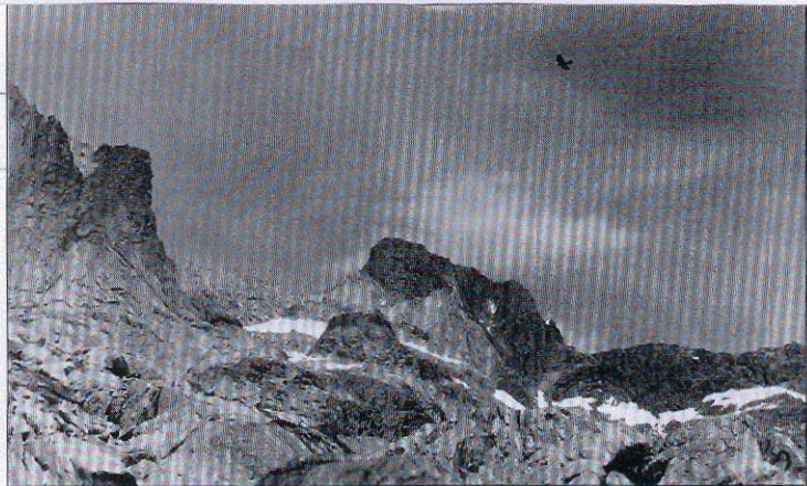
△Bernard Plossu, Dibona Alpes .

Ma anche la montagna come ascesa al punto più alto, sia fuori sia dentro se stessi, o come forma di scrittura celeste, semplice e indecifrabile al tempo stesso. Sarà dunque la montagna, in ogni sua possibile declinazione semantica, il tema cardine attorno al quale graviterà Omaggio ad Ansel Adams. Cattedrali di pietra - Cattedrali dell'anima , la grande mostra che verrà allestita presso la Galleria Repetto di Acqui Terme (via Amendola 21/23) a partire dal 7 maggio. Un'esposizione articolata, e per certi versi polifonica , ideata appositamente per rendere omaggio a un fotografo americano imprescindibile: Ansel Adams appunto. Il lungo percorso espositivo proposto punta infatti a riunire non solo una trentina di opere sull'argomento parte della vasta produzione di questo celebre Maestro, ma anche una serie di lavori realizzati sul tema da fotografi del calibro di Minor White, Vittorio Sella e Albert Steiner da un lato (raggruppate sotto l'etichetta di Cattedrali di pietra ), e da Luigi Ghirri, Richard Long ed Hamish Fulton dall'altro ( Cattedrali dell'anima ),