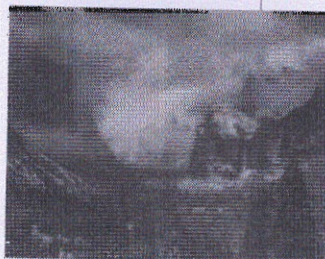
Ansel Adams, Clearing winter storm , 1938, cm 98,4x132,1.

A ggiudicata nel giugno 2010 da Sotheby's a 584mila euro, una sua classica veduta in bianco e nero del parco nazionale di Yosemite, scattata nel 1938 ma stampata negli anni Cinquanta o Sessanta, ha stabilito il nuovo record d'asta di Ansel Adams (San Francisco, 1902 - Carmel, 1984). Nonostante siano almeno sedici le immagini battute a prezzi superiori ai centomila euro, i prezzi medi oscillano tra i 4/5mila euro delle Parmelian prints of the High Sierras , di piccolo formato, ai 35/40mila euro dei soggetti più conosciuti e ricercati, come Half dome . Al grande maestro della fotografia americana di paesaggio dedica una mostra, dal 16 aprile al 28 maggio, la galleria Repetto di Acqui Terme (tel. 0144-325318).