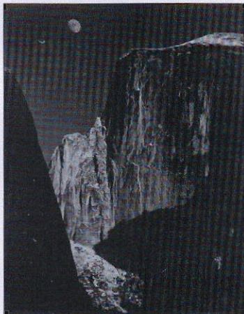
△Ansel Adams, Half dome and moon , 1960. Fotografia in bianco e nero, 50x38,8cm.

La montagna come epifania o manifestazione del sacro. Le rocce, i ghiacci, i laghi, gli alberi e i prati di cui è costituita come segni tangibili di una divinità pervasiva e nascosta, presente e misteriosa.